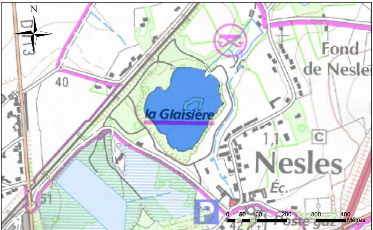
ETANG GLAISIERE DE NESLES